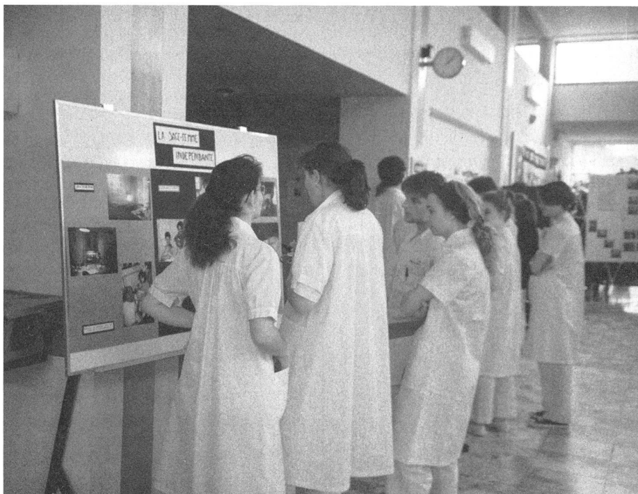
Journée internationale de la sage-femme à Chantepierre.

Pour marquer l'événement du 5 mai, nous (une élève et deux enseignantes) avons préparé une exposition de photos dans le hall de l'école. Notre but était de montrer l'activité de la sage-femme au cours de la formation, le travail dans le cadre d'une maternité et à domicile. La majorité du public était constituée par les élèves infirmières en cours ce jour-là, mais il y eut aussi des soignants du CHUV et le personnel de l'école. Nous avions un stand et étions là pour répondre aux questions et informer sur la formation. Conjointement à l'association vaudoise des sages-femmes, nous vendions une carte postale en faveur d'orphelins ougandais dont les parents sont morts du SIDA.