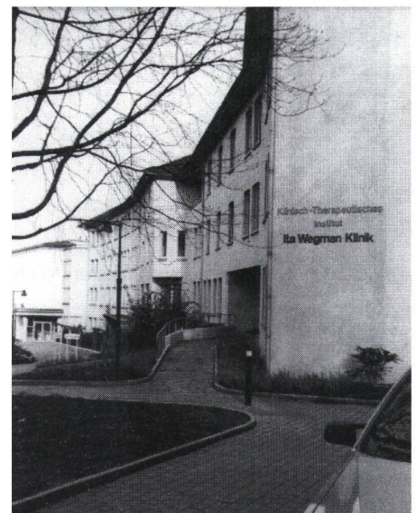
Klinisch-Therapeutisches Institut, Ita Wegman Klinik, Arlesheim

In der Ita Wegman Klinik möchte man den Neugeborenen, die aus der Gebärgenheit heraus geboren werden, Schutz, Wärme und Ruhe gewähren. Sie sollen nicht unnötig gestört werden und ihre Sinne voll entfalten können. □