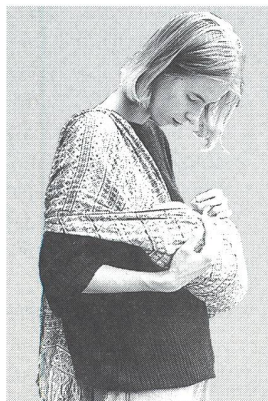
liegend in der »Wiege«

von Erica Hofmann aus 100% ökologischer Baumwolle, Wolle oder Leinen, elastisch gewebt, waschmaschinenfest schöne Farben, viele Muster, in Längen bis 400 cm + mehr