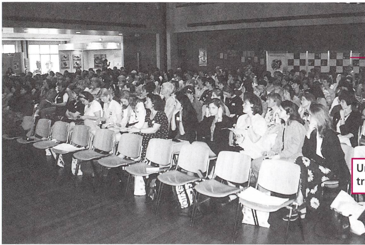
Un auditoire très attentif.