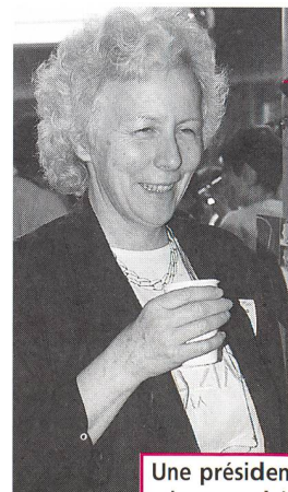
Une présidente dynamique et pleine d'allant.

Un de nos premiers succès fut le lobbying important fait après l'annonce de l'arrêté fédéral urgent de décembre 1991 mettant un terme à toute négociation avec les caisses-maladie. Nous avons été entendues et des négociations au niveau suisse ont alors pu reprendre sur la nouvelle convention tarifaire. De même, les conventions tarifaires cantonales qui n'avaient pas subi de modifications avant fin 1988 pouvaient être réévaluées. Ce qui se passa alors dans plusieurs cantons.