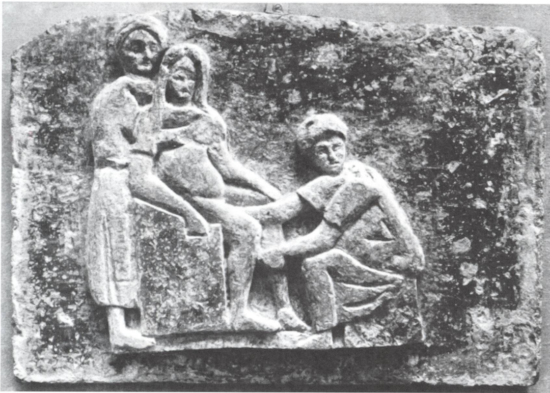
Scène d'accouchement en terre cuite, trouvée sur le monument funéraire d'une sage-femme à Ostie. La scène correspond bien à la description qu'en fait Soranos: siège obstétrical à poignées, aide se trouvant derrière la parturiente et la soutenant, petit tabouret bas pour la sage-femme, etc. (Musée d'Ostie).

car connaître c'est se souvenir de ce qu'on a appris; l'ardeur au travail lui donne de la résistance vis-à-vis des imprévus (il faut en effet une résistance toute masculine à qui désire acquérir une telle somme de connaissances); la discrétion se justifie puisque les familles se fient à la sage-femme, et qu'elle a accès aux secrets des êtres (les moins sérieuses prennent prétexte pour tramer quelque malhonnêteté de leurs prétendues connaissances médicales). Il lui faut aussi des sens aiguisés pour enregistrer certains détails par la vue, d'autres par les réponses aux questions qu'elle pose, d'autres encore grâce au toucher. Si ses membres doivent être bien proportionnés, c'est pour lui éviter toute gêne dans les activités de son ministère. La robustesse s'impose parce qu'en raison de la fatigue physique que lui causent ses tournées, elle fournit double travail. Elle doit enfin avoir les doigts longs et fins, et les ongles ras, pour pouvoir toucher sans risque de lésion une zone enflammée profonde.» (Gynécologie, I, 3)