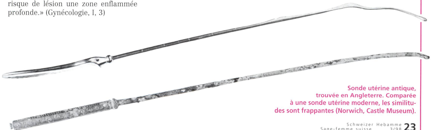
Sonde utérine antique, trouvée en Angleterre. Comparée à une sonde utérine moderne, les similitudes sont frappantes (Norwich, Castle Museum).

En Grèce, la profession de sage-femme était bien reconnue, car il nous reste des extraits de traités gynécologiques écrits par des femmes, cités par des auteurs masculins (ce qui est digne d'être mentionné, dans une société si machiste!). C'était là une profession respectable qui permettait de vivre de ses gains. La situation semble différente à Rome, où la plupart des sages-femmes étaient d'origine servile (affranchies, c'est-à-dire anciennes esclaves rachetées) ou filles d'affranchies. Les noms de ces femmes (quand ils nous sont parvenus au travers des inscriptions) confirment cette hypothèse. La plupart ont des noms grecs (les Grecs