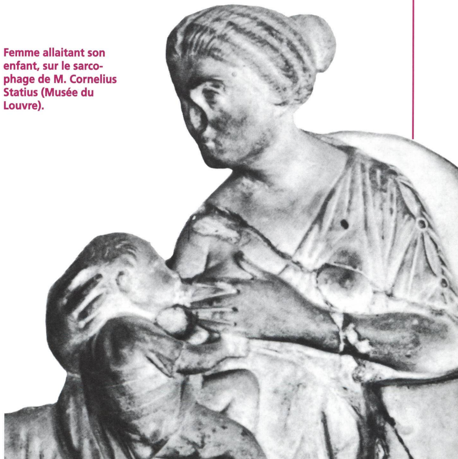
Femme allaitant son enfant, sur le sarcophage de M. Cornelius Staius (Musée du Louvre).