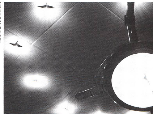
Nicht zuletzt auf Druck von Elternguppen mussten in Deutschland die klinisch-sterilen Gebärsäle freundlicheren Einrichtungen weichen.

Das Angebot zur Schmerzbekämpfung wird häufig genutzt – je nach Spital von ein bis über zwei Drittel der Gebärenden –, was impliziert, dass in der deutschen Gesellschaft nur eine geringe Akzeptanz der Geburtsschmerzen vorhanden ist, oder dass die deutschen Frauen besonders schmerzempfindlich sind. Schmerz wird in Deutschland generell negativ gesehen. Beeinflusst wird dies auch durch die Schwierigkeit des geburtshilflichen Personals, mit den Schmerzen der Gebärenden umzugehen und Stöhnen und Schreie zu akzeptieren. In Kliniken werden Frauen oft schmerzfreie oder schmerzarme Geburten offeriert und neue Analgesieformen propagiert. In den letzten Jahren hat sich – aufgrund einer allgemein kri-