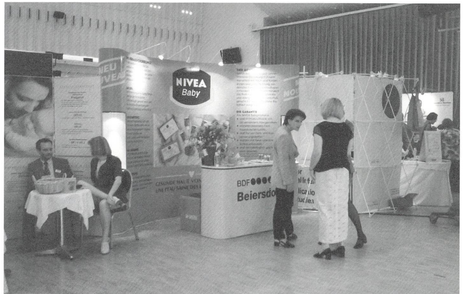
La visite des stands est toujours enrichissante.

J'ignore pourquoi dans la pratique quotidienne quelques sages-femmes sont si réticentes à partager leur expérience. Peut-être ceci est-il à mettre en relation avec la concurrence, le surcroît de travail, le manque d'intérêt à conseiller des élèves sages-femmes? Il appartient à chacune d'analyser sa retenue ou les raisons de cette retenue.