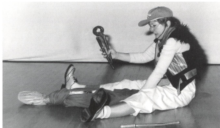
Merci aux Clownanalystes pour leur superbe prestation qui a permis à une audience subjuguée de comprendre la recherche de manière humoristique, sans enlever le sens de la présentation des intervenants, sans moquerie, mais avec finesse, respect, subtilité et tendresse.

Pour calculer le montant global destiné aux affections des nourrissons, on a rapproché le coût unitaire des maladies et le risque propre à chaque type d'allaitement. Compte tenu du fait