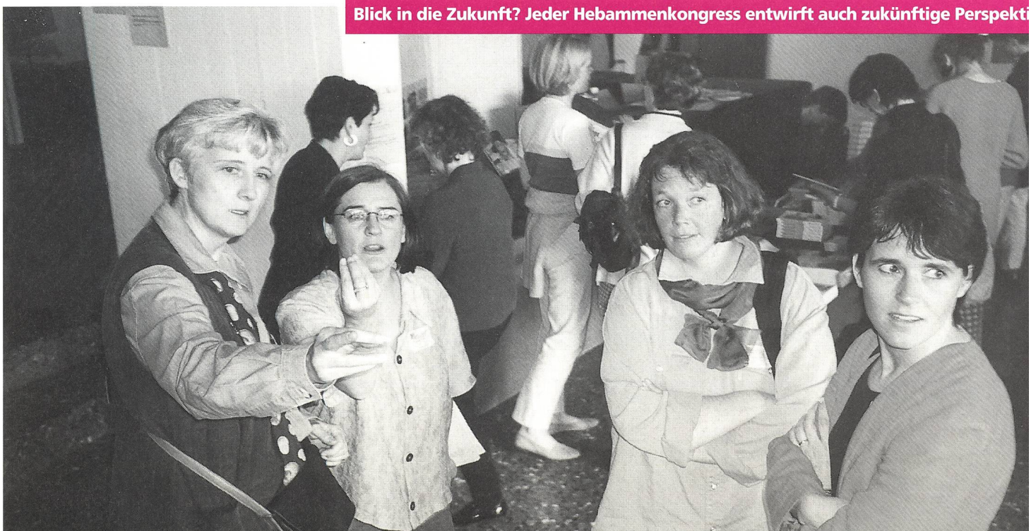
Blick in die Zukunft? Jeder Hebammenkongress entwirft auch zukünftige Perspektiven.