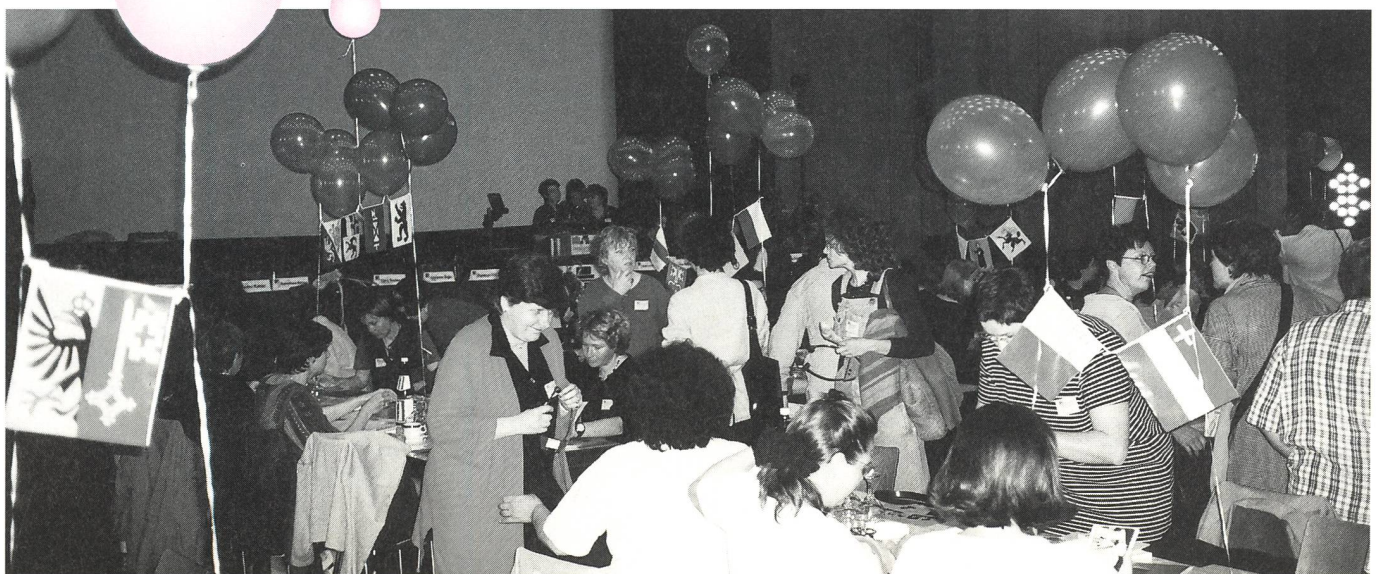
Noch schweben die Ballons über den Tischen: Delegiertenversammlung.

Jede Gesellschaft hatte seit jeher ihre Drogen. In allen uns bekannten Kulturen hatten die Rausch- und Genussmittel immer auch eine kultische Bedeutung. Die Familie als Urkern eines sozialen Gefüges, der Gesellschaft,