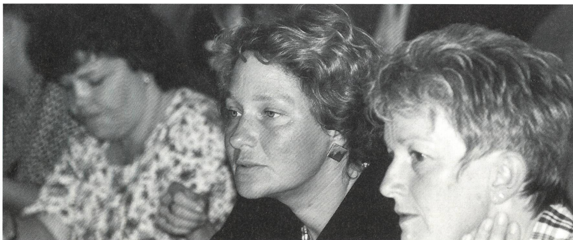
Zuhören, austauschen, engagiert dabeisein.

Es liegt auf der Hand, dass die heutigen Ehen und Beziehungen, ganz im Gegensatz zum 19. Jahrhundert oder früheren Perioden, vom Abflauen sexuell intensiver Erlebnisse oder dem Erkalten der Leidenschaft besonders bedroht sind.