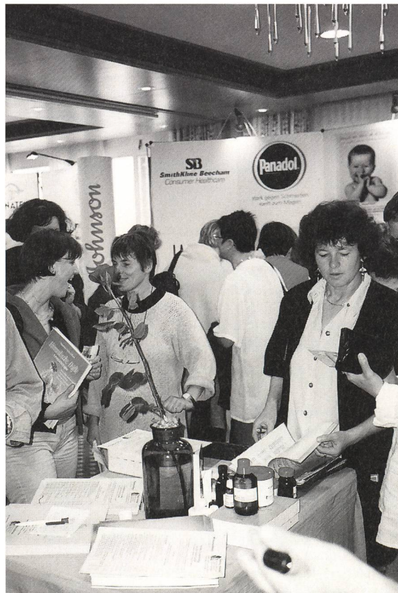
Grosses Interesse für die Produktausstellung.

Der Quartärbereich ist ausgerichtet auf die Arbeit mit chronisch Abhängigen (sozial, beziehungsmässig und hirnorganische Schädigungen aufweisende Abhängige), von uns sozial ausgegrenzte Menschen. Die Zielsetzung der Abstinenz steht nicht mehr im Vordergrund. Wichtig sind überlebenssichernde Massnahmen, welche niederschwellig angeboten werden, das heisst ohne die Erfüllung von Vorbedingungen zugänglich sind.