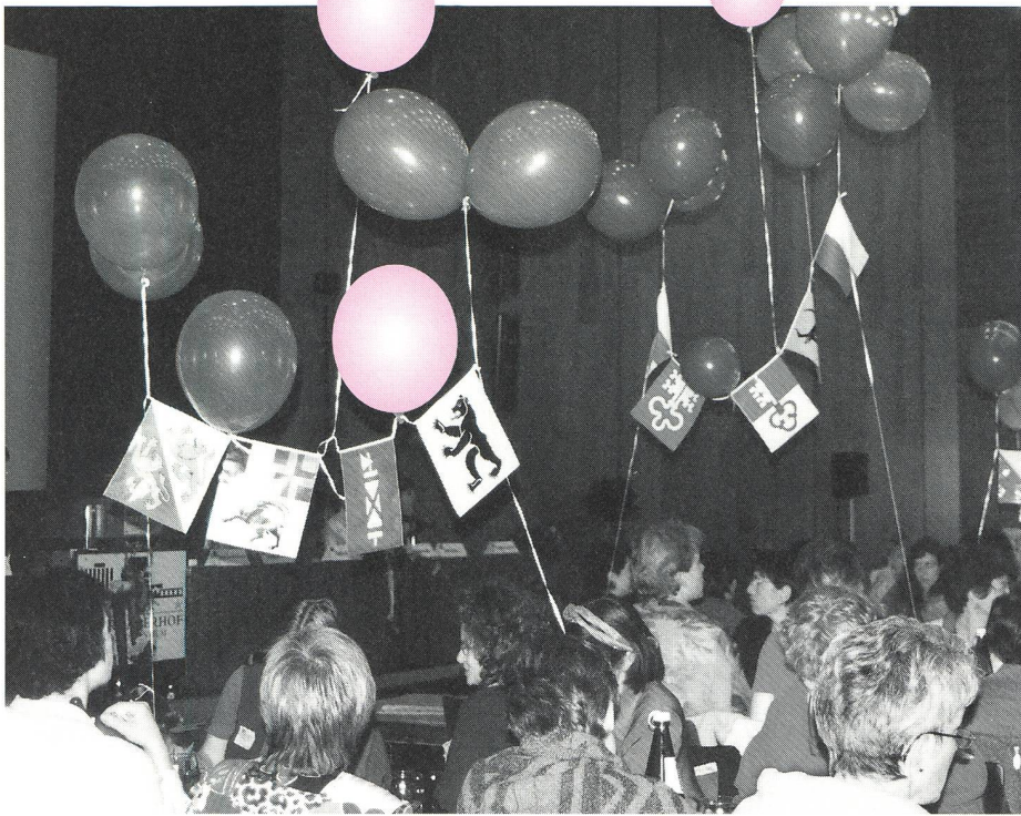
Une ambiance chaleureuse et attentive régnait dans la salle de congrès, rehaussée par des ballons colorés (et parfois baladeurs!).

Aujourd'hui, la famille se réduit à son noyau: un couple et ses enfants. Par cette réduction et la perte de la base commune de pure production, les rapports s'émotionnalisent: les liens du couple l'un envers l'autre et des parents envers leurs enfants laissent place aux sentiments, garantissant la cohésion de la famille. De fait, c'est la naissance de l'enfance, en tant qu'institution sociale, distincte du monde des adultes, qui fonde la famille moderne.