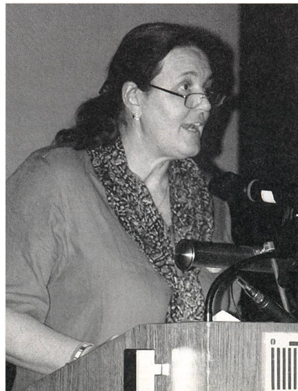
Invitée d'honneur de cette édition: Madame Maria Spornbauer, sage-femme autrichienne et actuelle présidente de la Confédération internationale des sages-femmes (ICM).

Il y a quatre stades en matière de prévention. La prévention primaire comprend les mesures qui servent à la