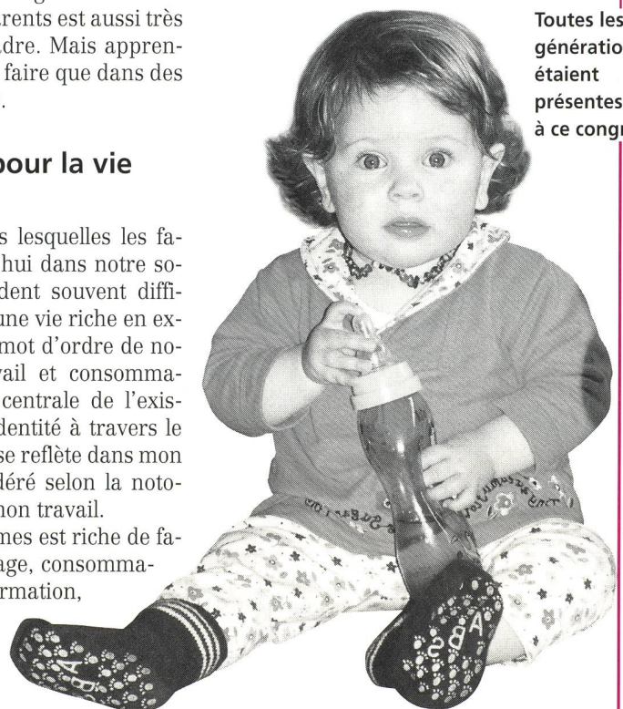
Toutes les générations étaient présentes à ce congrès!

L'OMS a défini en 1957 la dépendance ainsi: «c'est un état d'empoisonne-