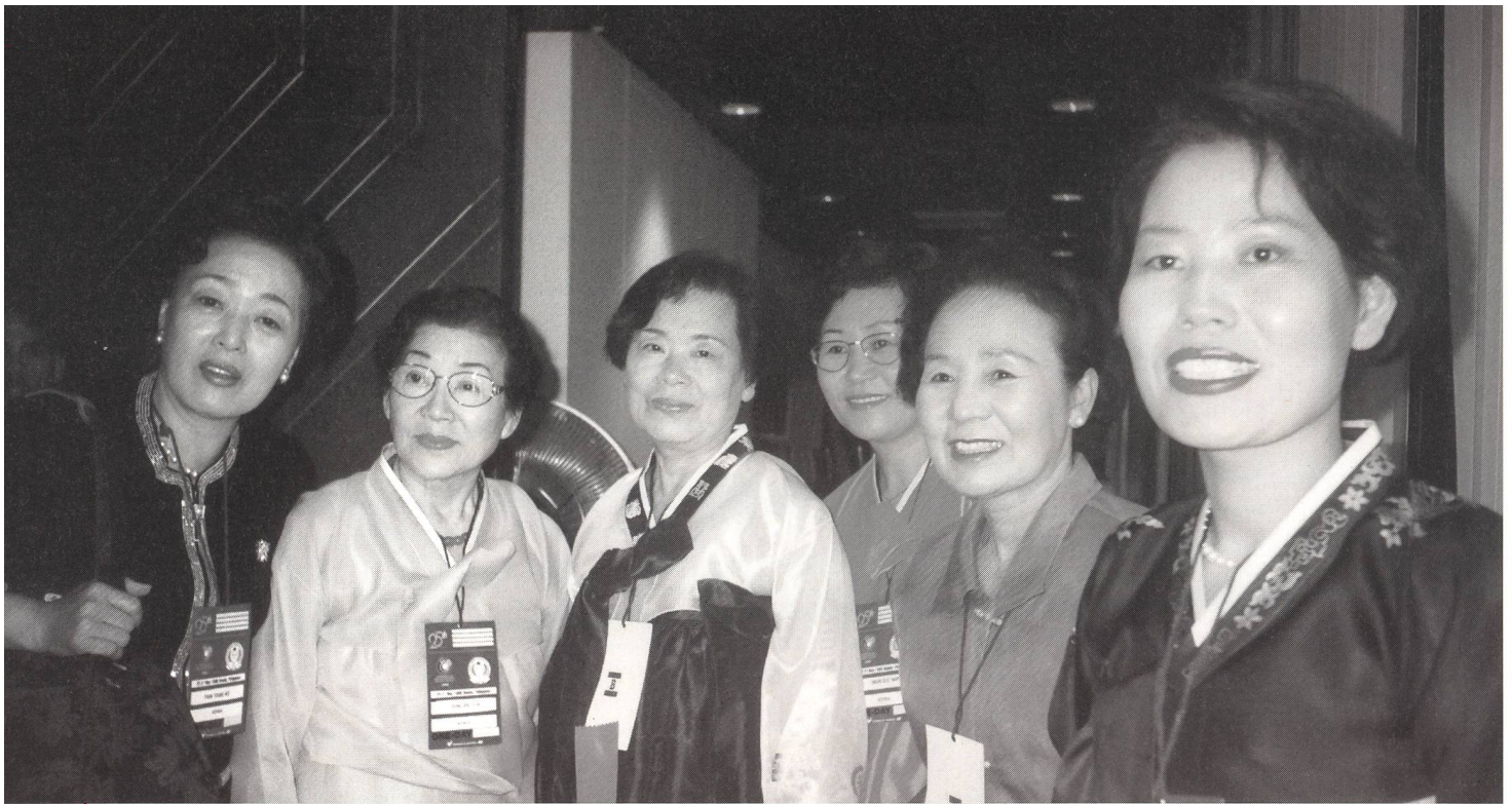
Hebammendelegation aus Südkorea.