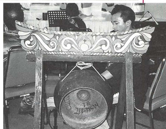
Musique traditionnelle philippine.

Les femmes peuvent se présenter à l'accouchement en ayant ou non été vic-