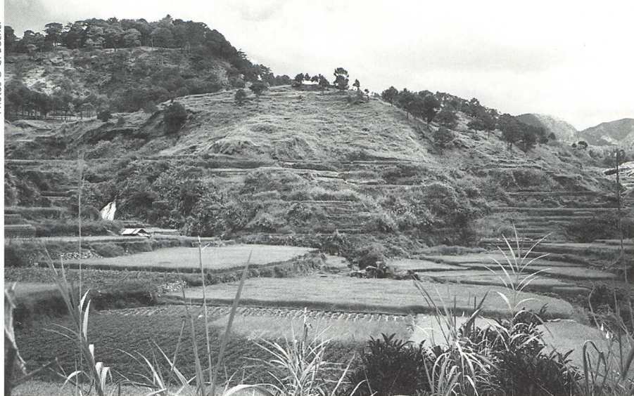
Paysage typique des Philippines.

Les résultats du tableau 1 montrent que les opinions divergent au sujet de la prévalence d'abus sexuels durant l'enfance. Seules cinq sages-femmes (2,7%) rapportent une incidence de 26-30%. La majorité des sages-femmes interrogées (146, soit 80,2%) sous-estiment la prévalence d'abus sexuels durant l'enfance. Il est possible aussi que cette sous-estimation soit due au fait que le questionnaire ne définit pas la notion d'abus sexuels durant l'enfance, ce qui signifie que les sages-femmes se sont basées sur leur propre perception de cette notion pour sélectionner un taux de prévalence. Cette sous-estimation