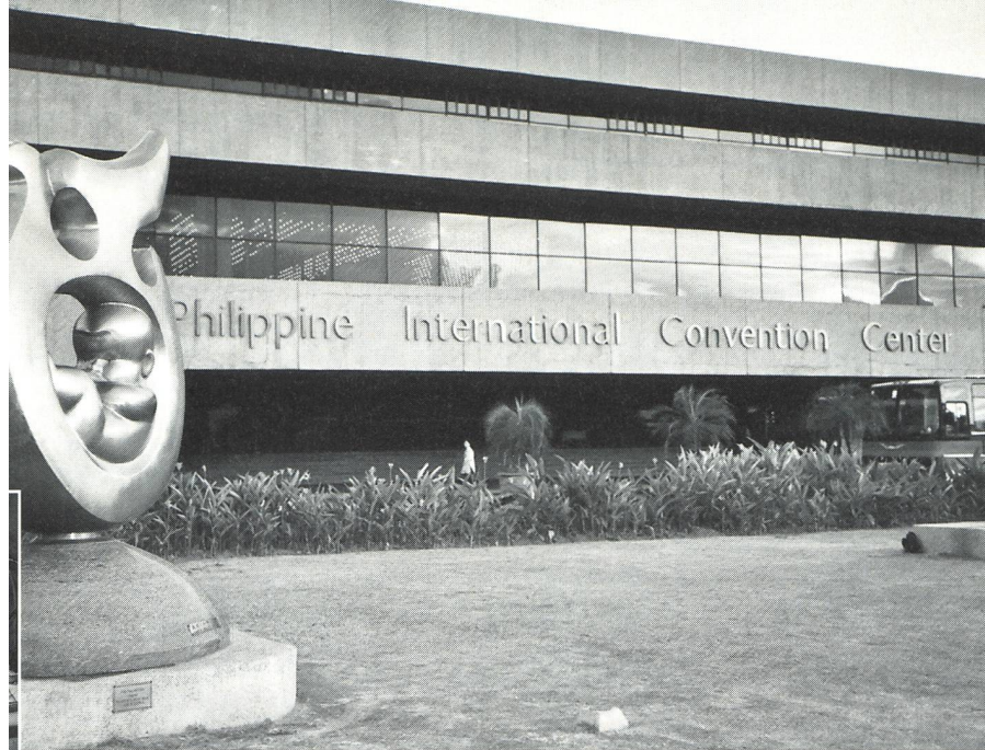
Scène de la vie ordinaire dans une maternité de Manille.