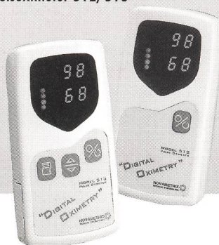
NEU Novametrics Pulsoximeter 512/513

Profitieren Sie vom Einführungspreis bis Ende April Verlangen Sie die gewünschten Unterlagen