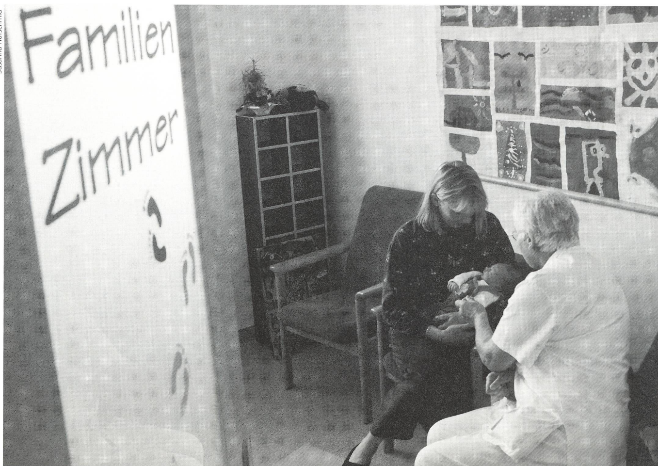
Das Thema Inkontinenz nach der Geburt wird von den jungen Müttern selbst meist nicht angesprochen. Deshalb müssen Hebammen und Pflegende bei der Nachuntersuchung konkret nachfragen.