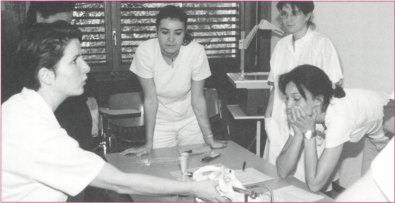
«Le compagnonnage, comme méthode d'apprentissage des futures sages-femmes, est connu et adopté depuis longtemps dans les différents stages hospitaliers. Cette méthode pédagogique correspond bien à l'apprentissage du savoir pratique de la sage-femme.»

d'une participation réelle au travail de l'artisan».