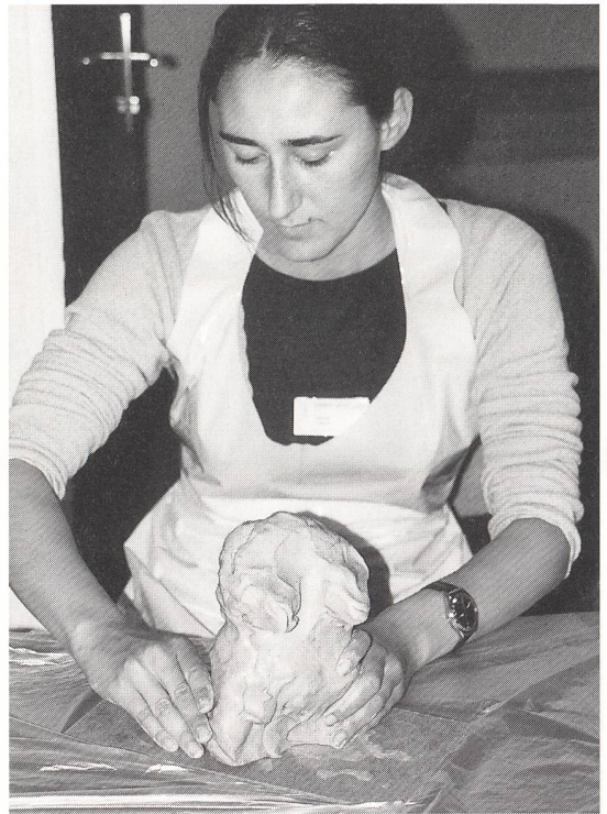
... und wie beim Modellieren?