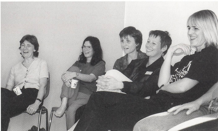
Bierernst ist nicht Sache der Hebammen!