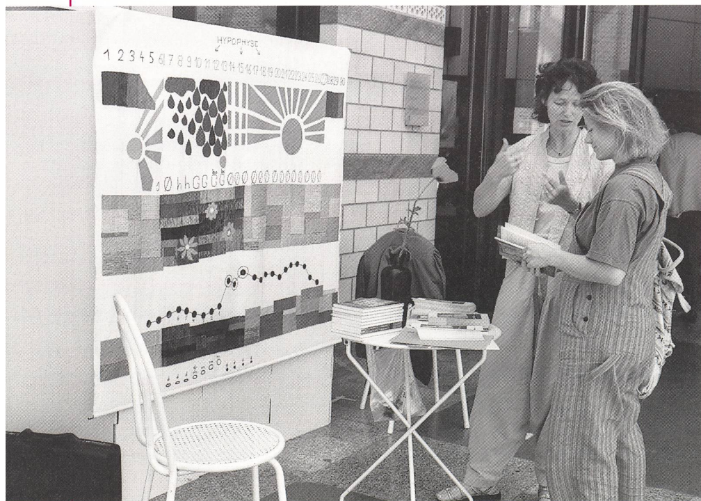
Le ForuMeyrin offrait un espace clair et aéré, propice à la découverte détendue des nombreux stands présents.