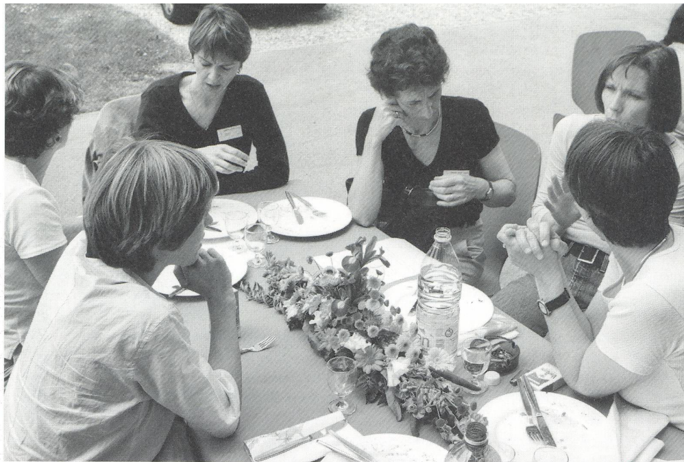
A la pause de midi, le comité de rédaction est en pleine effervescence: quels exposés paraîtront dans «Sage-femme suisse»?

qui joue le rôle déterminant de la consultation de ces mariages blancs, même si elle se trouve quelquefois associée à une dysfonction masculine de type éjaculation prématurée ou difficulté érectile secondaire.