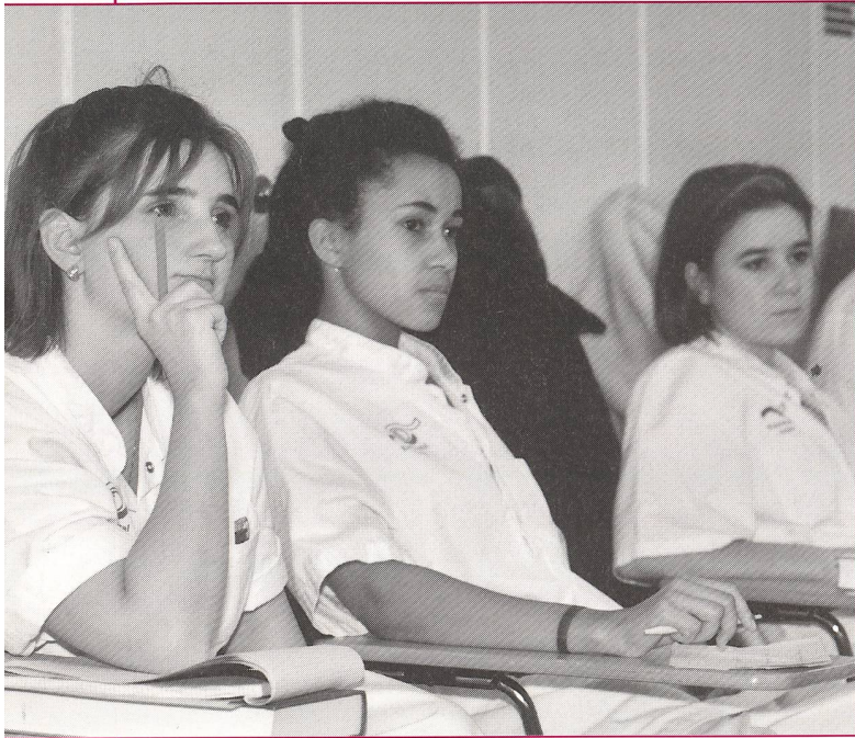
Die Hoffnung bleibt, dass in Zukunft auch in Luzern wieder Hebammen ausgebildet werden.