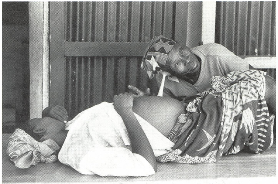
In vielen Ländern der Welt betreuen Hebammen nicht nur Schwangerschaft und Geburt, sondern sind auch Zeremonienmeisterinnen der begleitenden Rituale.

Während des Wochenbetts ruht die Mutter. Da sie wegen den Nachblutungen als unrein und ansteckend gilt und zudem leicht Opfer böser Geister werden kann, darf sie weder das Haus verlassen noch kochen oder backen. Dennoch ist es gut für sie, sich viel zu bewegen; Pflege von Gesundheit und Schönheit stehen im Mittelpunkt. Die Heb-