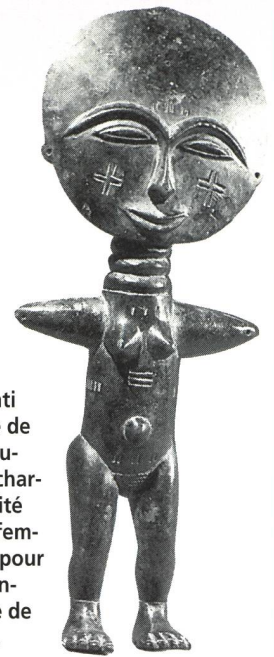
Chez les Ashanti (Afrique, Golfe de Guinée) ces poupées sont des charmes de fécondité portés par les femmes enceintes pour s'assurer des enfants, et même de beaux enfants.

Jamais la sage-femme ne passera sa main au-dessus de la tête de l'enfant en coupant le cordon: cela le ferait loucher pour toujours. On ne ligature pas non plus le cordon: matin et soir, il est lavé à l'eau tiède et enduit de beurre de karité et d'huile chaude jusqu'à ce qu'il tombe.