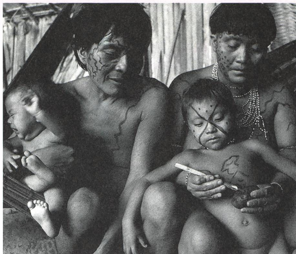
Chez les Yanomani (Amazonie) la peinture corporelle est une activité sociale importante. Elle permet de transmettre des messages codés, explicites ou non, entre amants et couples se courtisant.

En Afrique, si une femme omboundou veut un bébé de sexe masculin, elle échangera sa nourriture contre celle d'une mère ayant déjà engendré des mâles. Une femme soutu se couchera tout de suite sur le côté droit après le rapport sexuel pour