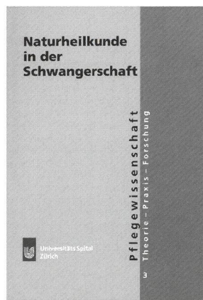
«Naturheilkunde in der Schwangerschaft». Projektgruppe Pränatalstation UniversitätsSpital Zürich. 2001. Erhältlich bei Orell-Füssli Zürich und Huber Verlag Bern, Fr. 30.–.

Zu Recht sind sie stolz auf ihr Werk: Ein Team der Gebärd- und Pränatalabteilung des Universitätsspitals Zürich bestehend aus Hebammen, Krankenschwestern und einer Ernährungsberaterin hat ein Übersichtsbuch über den Einsatz von Naturheilkunde in der Schwangerschaft verfasst.