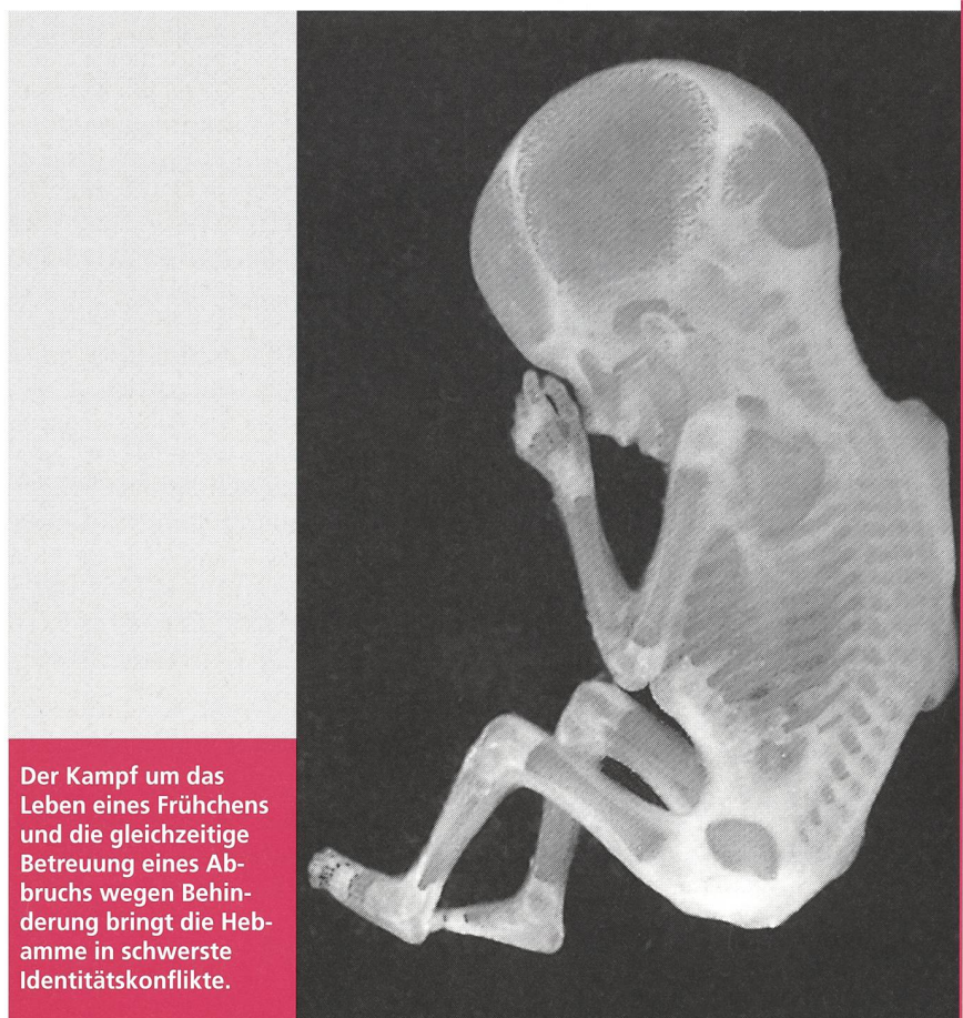
Der Kampf um das Leben eines Frühchens und die gleichzeitige Betreuung eines Abbruchs wegen Behinderung bringt die Hebamme in schwerste Identitätskonflikte.

In den Interviews kommt trotz der klaren Ausrichtung an diesen ethischen Werten ein ausgeprägtes Unbehagen der Hebammen und die damit verbundenen schweren beruflichen Identitätsprobleme zum Ausdruck. Hier muss von einem Verdrängungsmechanismus ausgegangen werden, der durch die Ausblendung der ethischen Fragestellungen um das Kind den Hebammen eine Umgehung der Entscheidungsfindung im Dilemma ermöglicht. Die Ausblendung kommt vor allem