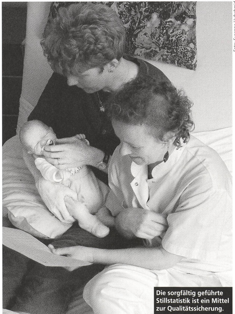
Die sorgfältig geführte Stillstatistik ist ein Mittel zur Qualitätssicherung.

38 Geburtskliniken und ein Geburtshaus in der Schweiz tragen heute das Zertifikat «stillfreundliche Geburtsklinik» und haben sich daher zur Durchführung der 10 Schritte zum erfolgreichen Stillen verpflichtet. Damit ihre Bemühungen nicht nachlassen, ist eine kontinuierliche Qualitätskontrolle erforderlich. Zum ersten Mal liegt nun eine Analyse der bisher gesammelten Daten (Stillstatistik) vor. Sie erlaubt einen aufschlussreichen Blick in die Wochenbettabteilungen.