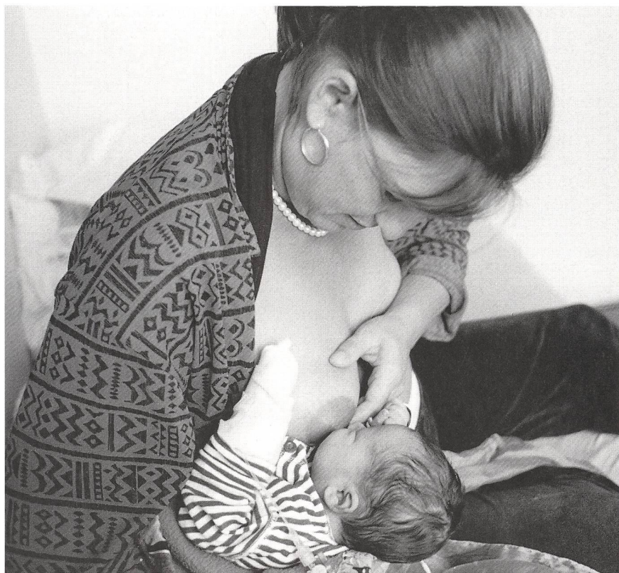
Stillzimmer Kinderspital: Auch mit Infusion und Magensonde lässt es sich stillen.