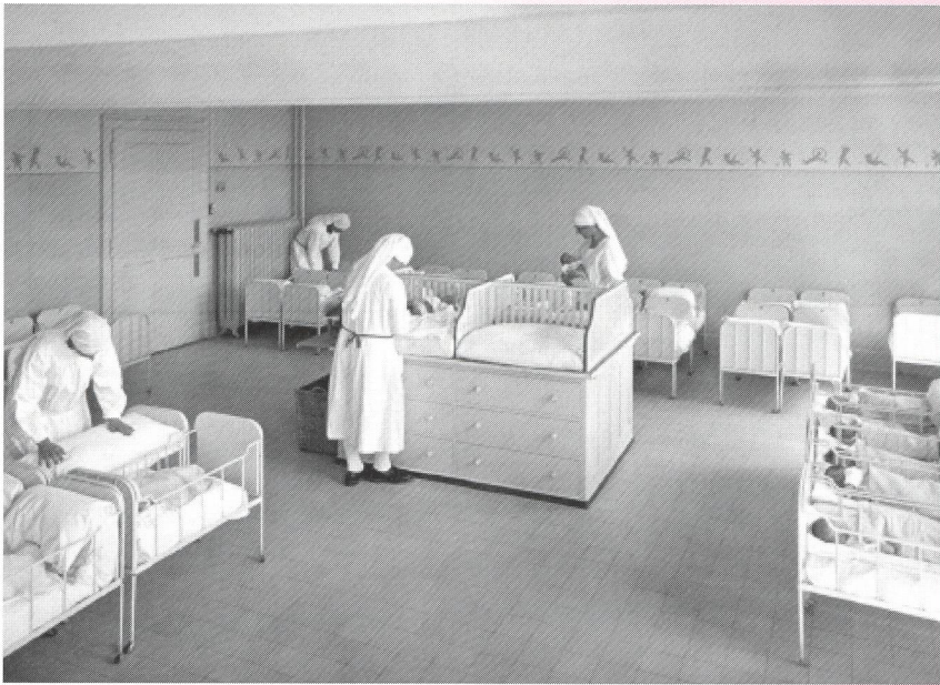
Le rooming-in? Terme encore inconnu. Mais la place, au moins, ne semble pas manquer!

trouve à Lausanne, mais il existe une deuxième section à Yverdon. Les sages-femmes romandes des cantons de Neuchâtel, Fribourg, Genève et Berne se tournent vers ces deux sections, plutôt que vers la Suisse allemande.