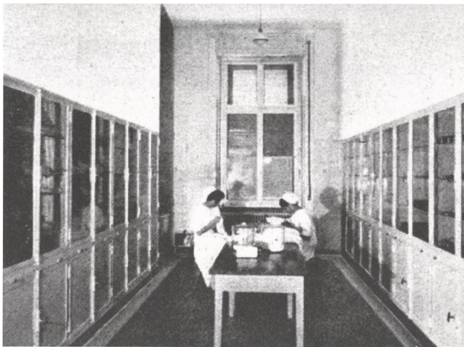
Univers nu et aseptisé pour la préparation des biberons.

Les thèmes abordés sont les suivants: la définition des droits et devoirs des sages-femmes, la définition des limites