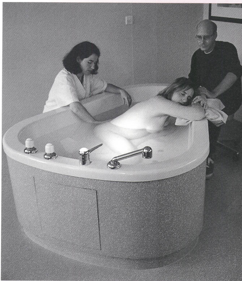
Wünsche und Vorstellungen der Gebärenden zur Schmerztherapie sollten vom Betreuungspersonal mitberücksichtigt werden.