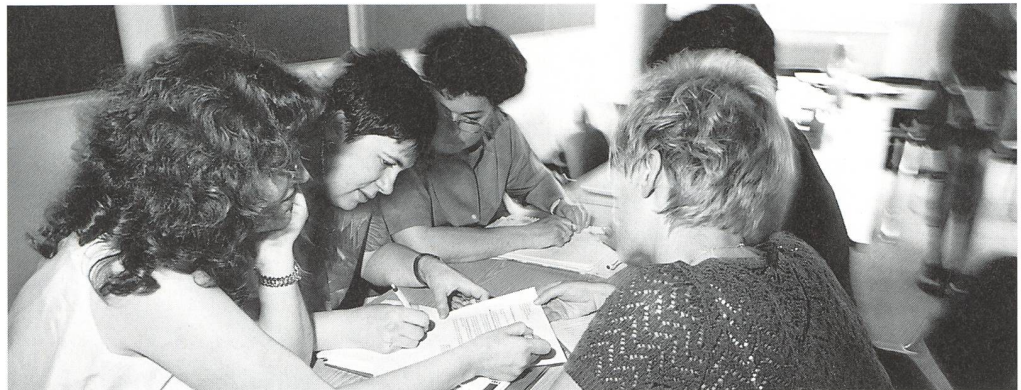
Comment accompagner les couples en matière de diagnostic prénatal ou les femmes et leurs proches en cas de dépendance? Ce cours tentera de répondre à ces questions (et à plein d'autres).

Le programme complet est construit sur 5 modules de 4 jours: – le 1 er jour de chaque module est axé plus particulièrement sur l'ap-