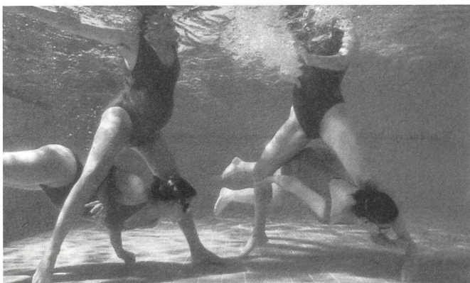
Nager en huit, pour tester son souffle: un exercice parmi d'autres, propre à la préparation à la naissance en piscine.