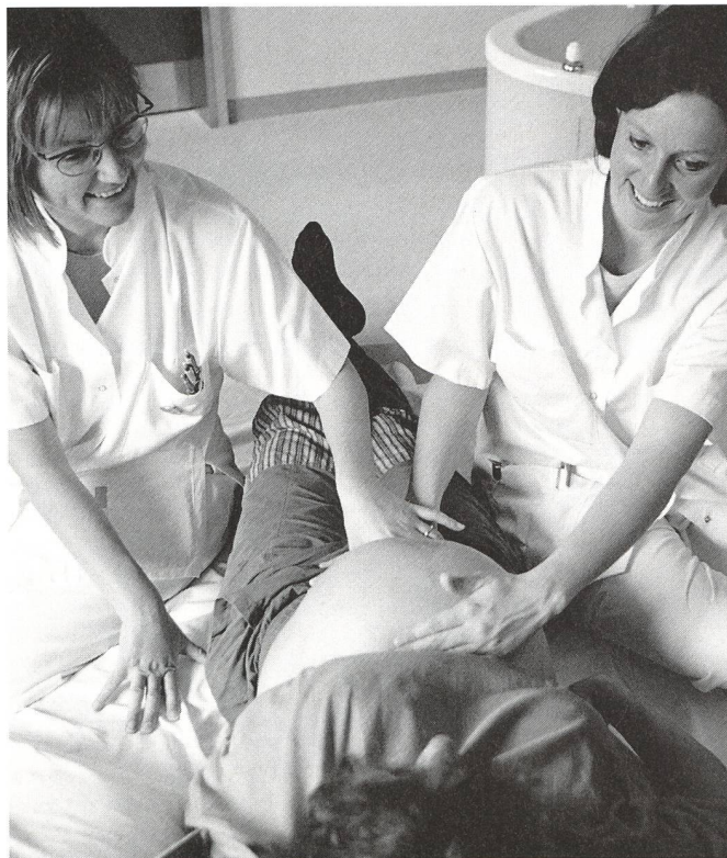
Les enseignantes ont généralement fourni aux sages-femmes des conseils et des «trucs» concrets, utilisables directement dans leur pratique.