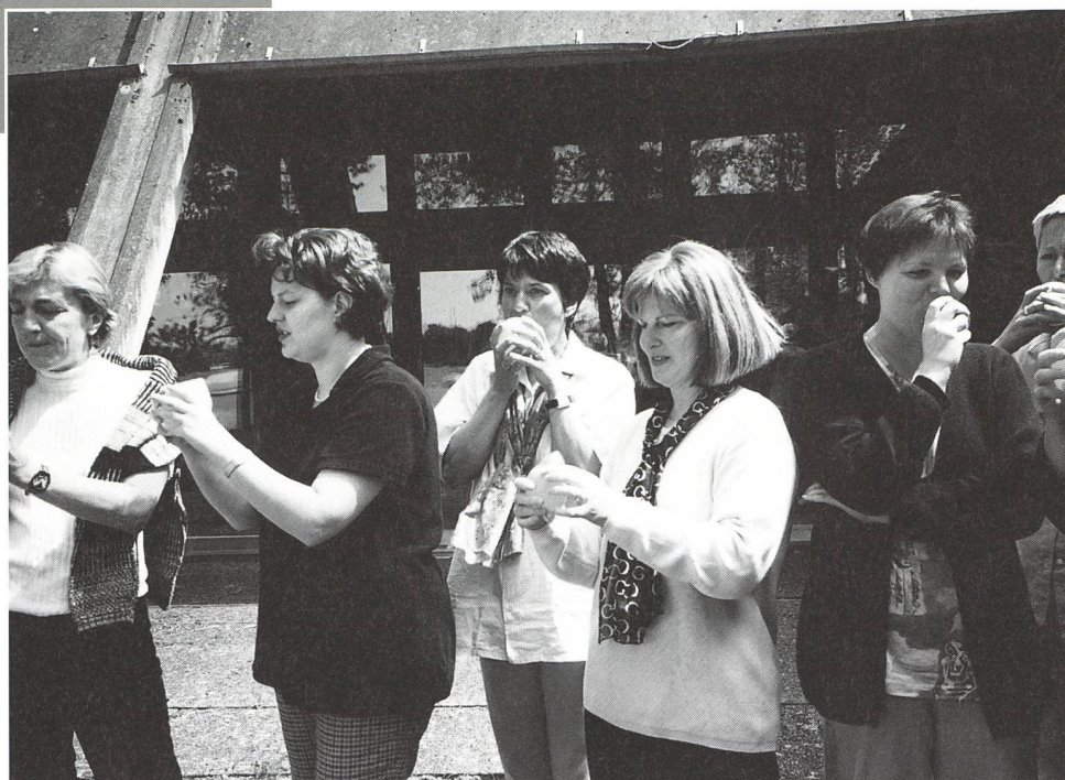
La formation de consultante en lactation comprend également des exercices, aussi pratiques que ludiques!