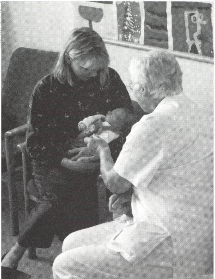
Les soins au bébé et l'allaitement sont les deux préoccupations des jeunes mères.

coup de poids dans la préparation à la naissance.