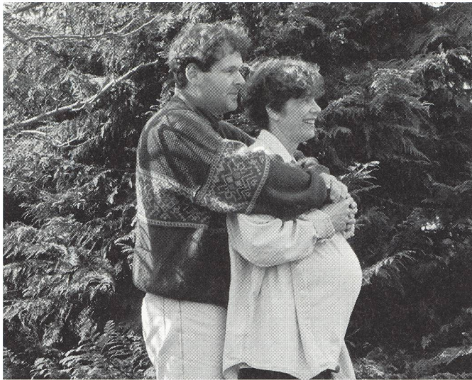
Si l'on désire que le père soit un réel soutien pour la mère allaitante, il est primordial qu'à son tour, il bénéficie d'informations, le plus tôt possible.

Dans cette étude, le primipère type a 30 ans, est originaire de France ou d'un pays européen et est en activité. Il a été très impliqué dans la