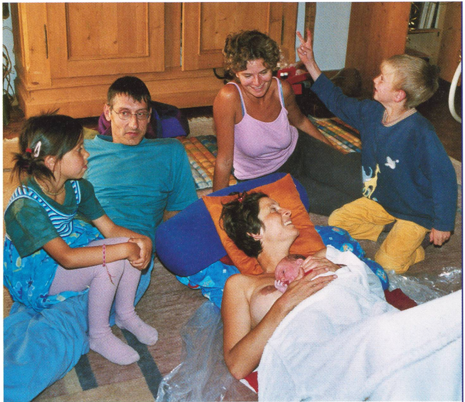
Die meisten Menschen halten eine Hausgeburt für risikoreicher als eine Geburt im Spital, auch wenn die Evidenz dies nicht unterstützt.

Die Kommunikation über Risiken gehört wesentlich zur informierten Zustimmung und Entscheidung. Ohne Kenntnis der einhergehenden Risiken können Frauen und Paare nicht informiert wählen.