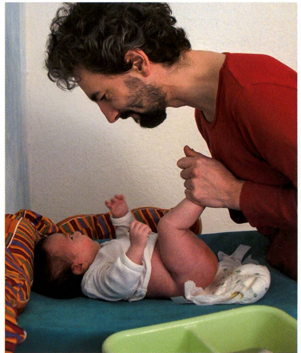
«Einem Baby ist es vollkommen egal, wie herum es die Windel anhat...»

Ich glaube, Väter sind andere Männer. Zumindest fühle ich mich so. Schon allein die Erfahrung, durch all diese Unsicherheiten gegangen zu sein und trotzdem noch ein lebenswertes Leben zu leben, nicht aufgegeben zu haben, das stärkt.