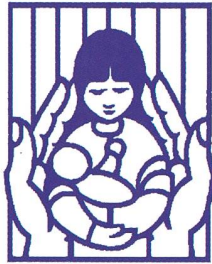
Birth compa- nions London