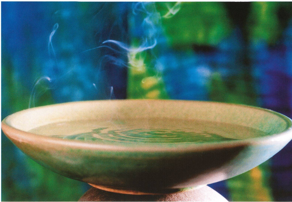
Aromatherapie mit Melisse, Lavendel, Rose oder Majoran kann bei vorzeitigen Kontraktionen helfen.