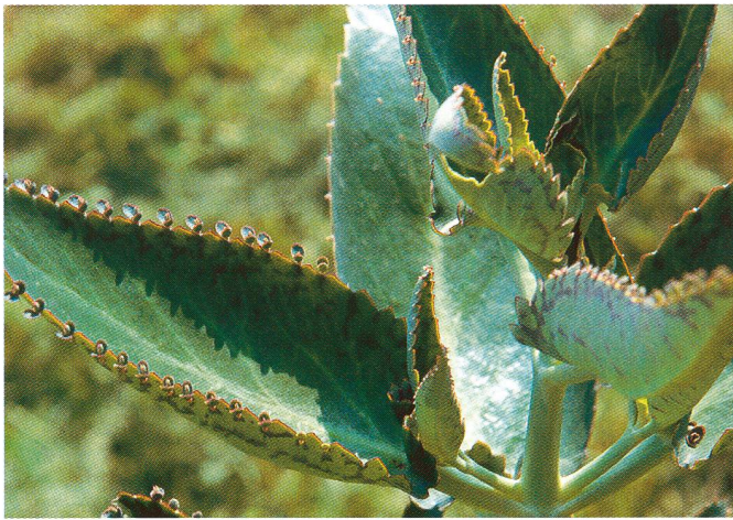
Die unscheinbare Pflanze Bryophyllum gilt auch als «pflanzliches Valium».

In der anthroposophischen Medizin wird Bryophyllum als pflanzliches Heilmittel (Hersteller: Weleda) oft eingesetzt. Einerseits gilt es