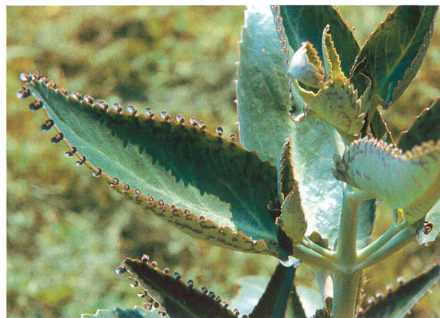
Bryophyllum Daigremontianum

Les résultats des expériences in vitro nous ont incités à entreprendre une 2 e étude dans la pratique clinique quotidienne. C'est ainsi qu'une étude rétrospective a comparé des patientes traitées avec le bryophyllum dans les cliniques anthroposophiques (Hôpital Paracelsus de Richterswil, Clinique Filder de Stuttgart et Maison de soins de Herdecke) et des patientes de l'Hôpital universitaire de Zurich ayant reçu une thérapie conventionnelle avec un antagoniste Beta synthétique. On a ainsi apparié au total 67 paires de femmes enceintes, qui étaient comparables au point de vue de leur âge et de la semaine de grossesse (début du traitement), nombre d'enfants nés auparavant et nombre de gestations, dilatation du col,