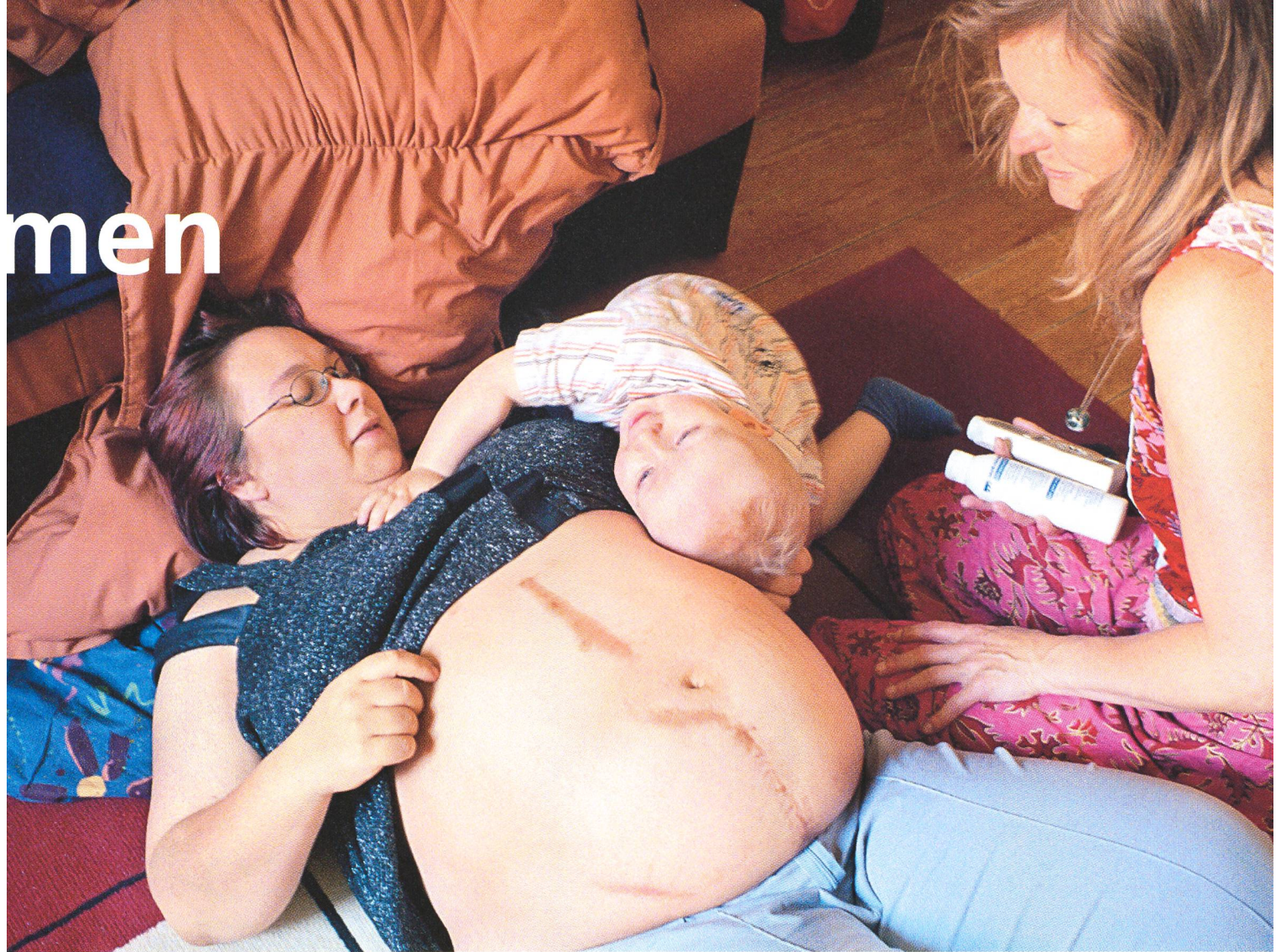
Hausbesuche stehen im Zentrum der Arbeit von Familienhebammen.