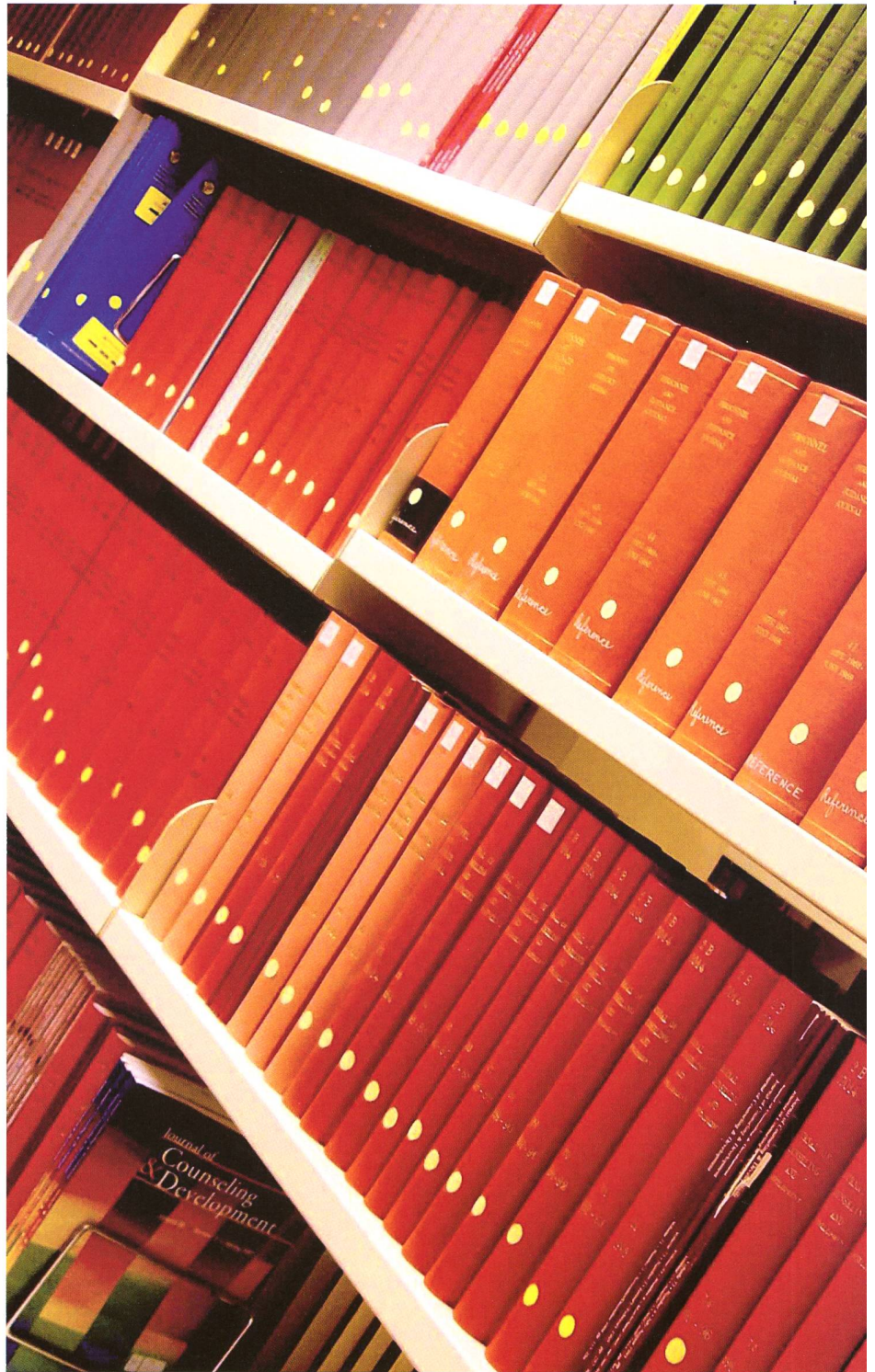
Systematisches Vorgehen bei der Informationssuche spart Zeit.

Die Suchergebnisse werden unterhalb des Suchformulars angezeigt. Angegeben