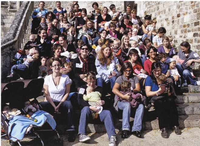
Le mans, 2009