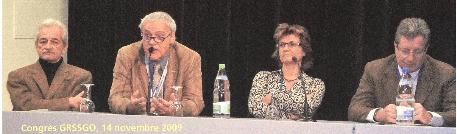
Congrès GRSSGO, 14 novembre 2009