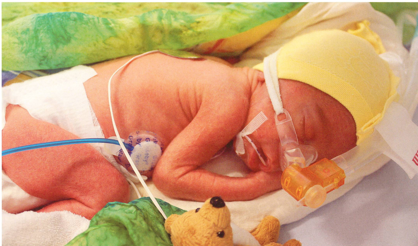
La position en flexion stimule le développement sensorimoteur.

guë, nous favorisons les approches qui aident le cerveau, par exemple en donnant des appuis et en positionnant l'enfant en flexion. Nous avons abandonné la position du malade «à plat sur le dos, membres étendus» forts du constat qu'après des hospitalisations longues (pour les plus jeunes de 3–4 mois), les enfants prématurés sortants avaient un tonus corporel dysfonctionnel et des difficultés proprioceptives et motrices considérables. Un positionnement qui exploite positivement la gravité terrestre, nouveau pour l'enfant prématuré, qui soutient son tonus musculaire et encourage qu'il se touche avec mains et pieds, favorise sa proprioception et stimule son développement sensorimoteur.