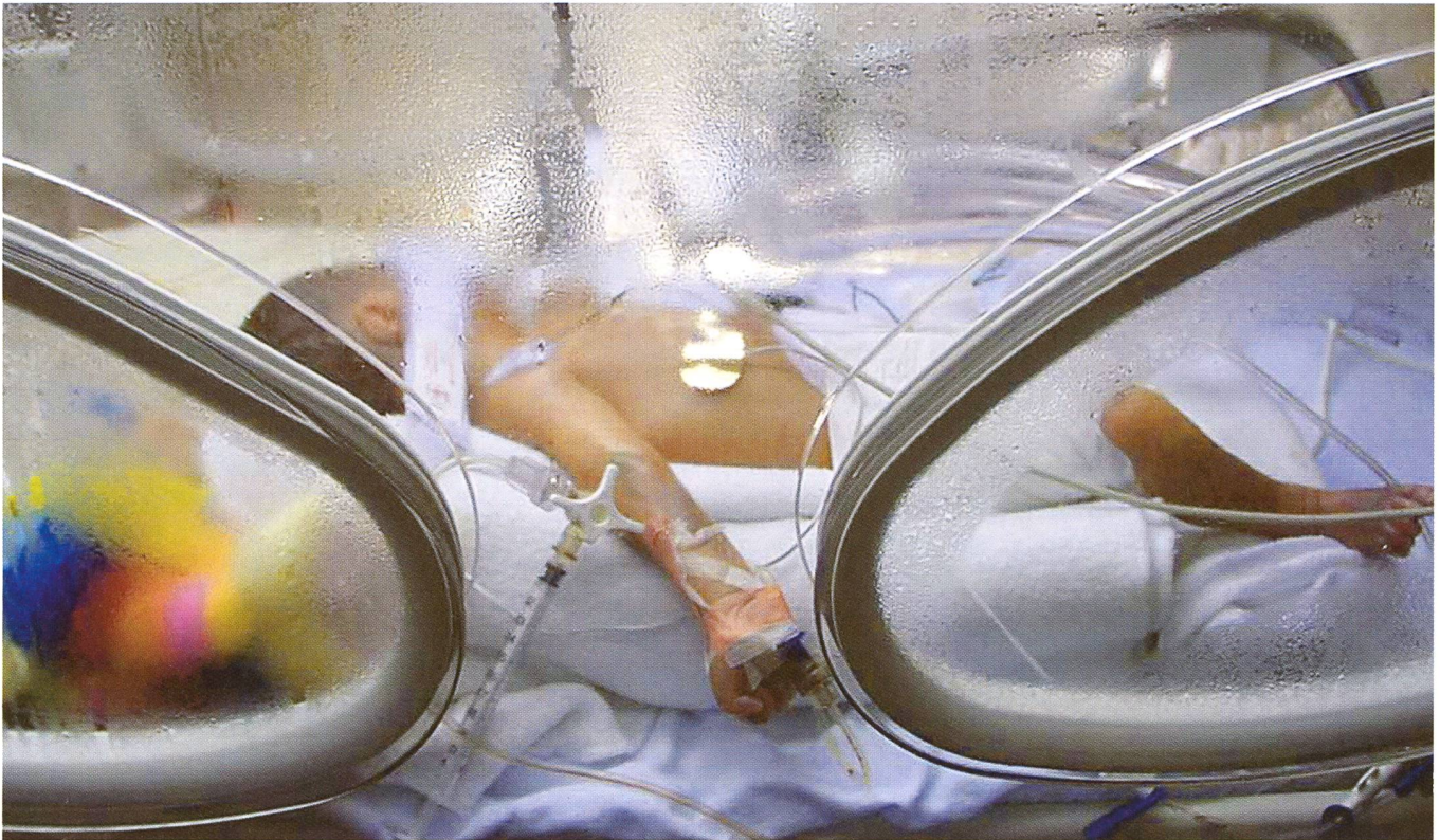
L'incubateur très hautement humidifié compense l'immaturation de la kératine.

chaque organe. La néonatalogie moderne cherche donc à donner à l'enfant les appuis et le support nécessaire pour faire l'adaptation de façon autonome, en évitant dans la mesure du possible les complications qui pourraient faire obstacle à ce processus et en donnant un maximum d'autonomie à l'enfant. La philosophie est donc : «Le moins possible». Passons quelques-uns des éléments importants en revue, en précisant quelles sont les attitudes et les pratiques nouvelles.