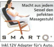
Macht aus jedem Sessel den perfekten Massagestuhl SMARTO Inkl. 12V Adapter für's Auto.

Kombiniert modernste Technik mit traditionellem Wissen. Nur wenn Sie es erlebt haben, werden Sie es glauben: „ Massiert wie die echten Hände! “ Die tiefwirkende Shiatsu Knetmassage stimuliert und stärkt die Rückenmuskulatur . Die äusserst sanfte Rollmassage regt Blutkreislauf und Lymphdrainage an. Die zuschaltbare, wohlthuende Wärmefunktion intensiviert die Tiefenwirkung der Massage noch zusätzlich. Die Vibrationsmassage wirkt muskelentkrampfend und fördert auch die psych. Entspannung . Und mit Swing lässt sich Ihr Chi-Fluss aktivieren und harmonisieren. 2 Jahre Garantie.