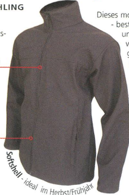
Softshell - Ideal im Herbst/Frühjahr