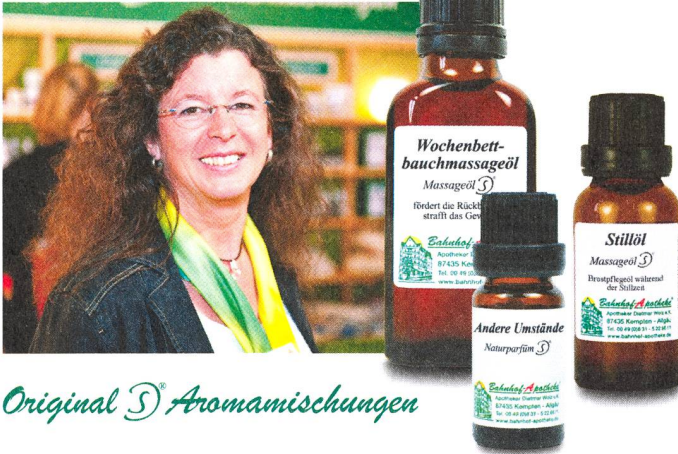
Original IS® Aromamischungen

Wöchnerinnen lieben zur Pflege das Wochenbettbauchmassageöl und das Stillöl . In der Erkältungszeit unterstützen Einreibungen und Auflagen mit Thymian Benzoe , Thymian-Myrte-Balsam extra mild oder Thymian-Salbei-Öl die junge Mutter.