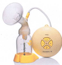
Swing™ komfortabel – leise – effizient