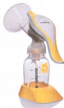
Harmony™ klein – praktisch – clever