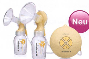
Swing maxi™ hocheffizient – komfortabel – schnell