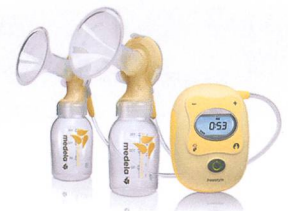
Freestyle™ universell – innovativ – zeitsparend