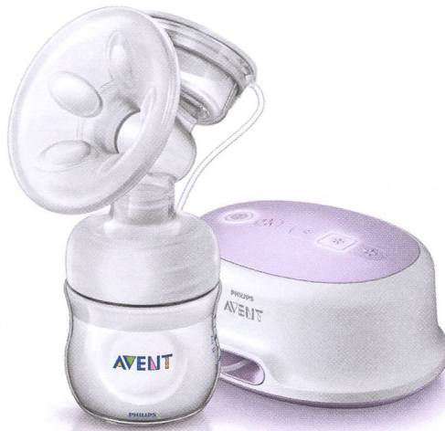
Tire-lait électrique Natural