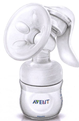
Tire-lait manuel Natural