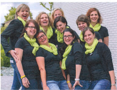
Das Organisationskomitee der SHV-Sektion Zürich und Umgebung

Aber warum benutzen wir dieses wenig zuverlässige Gerät trotzdem? Weil es uns mit konkreten Resultaten «schwarz auf weiss» ein Gefühl von Sicherheit vermittelt. Technologie scheint eben zuverlässiger zu sein als das Abhören, das Erfahrung und Kompetenz erfordert. Zudem