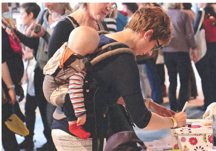
In den Pausen konnten sich die Kongressbesucherinnen austauschen und an den Ständen der Aussteller informieren.

Weitere Bilder unter www.hebamme.ch › Hebammen › Kongress › Kongress 2015: Basel