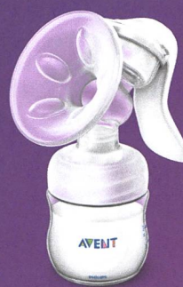
Tire-lait manuel Natural