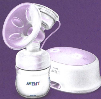
Tire-lait électrique Natural