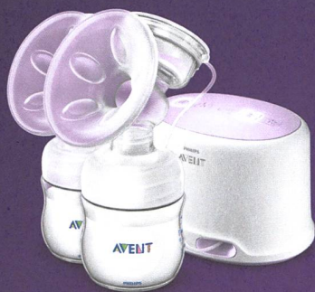
Tire-lait double électrique Natural

Les tire-lait Natural de Philips Avent ont été développés en collaboration avec les meilleurs spécialistes de l'allaitement en prenant exemple sur la nature. Ils permettent aux mamans de tirer leur lait de façon beaucoup plus confortable ce qui favorise la lactation.