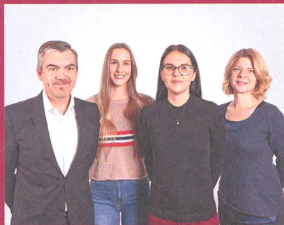
L'équipe du nouveau partenaire pour la régie publicitaire, rubmedia AG.