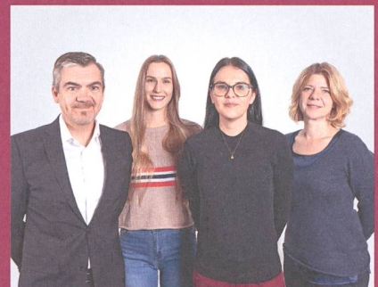
Il team di rubmedia AG, il nuovo partner per marketing e pubblicità.