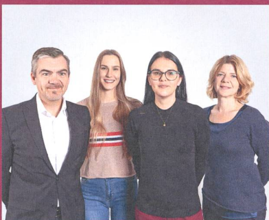
Das Team des neuen Anzeigenmarketingpartners rubmedia AG.