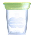
Aufbewahrungsbecher Pots de conservation