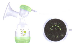
2in1 Einzelmilchpumpe 2en1 tire-lait individuel