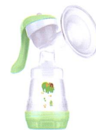
Handmilchpumpe Tire-lait manuel