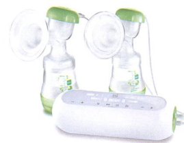
2in1 Doppelmilchpumpe 2en1 tire-lait double