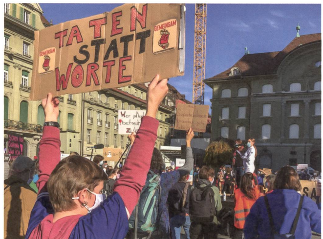
Amnesty International Schweiz