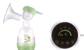
2in1 Einzel milchpumpe 2en1 tire-lait individuel