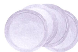
Stilleinlagen Coussinets d'allaitement