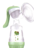
Handmilchpumpe Tire-lait manuel