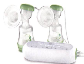
2in1 Doppel milchpumpe 2en1 tire-lait double